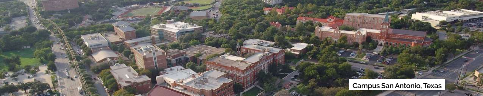
Campus San Antonio, Texas