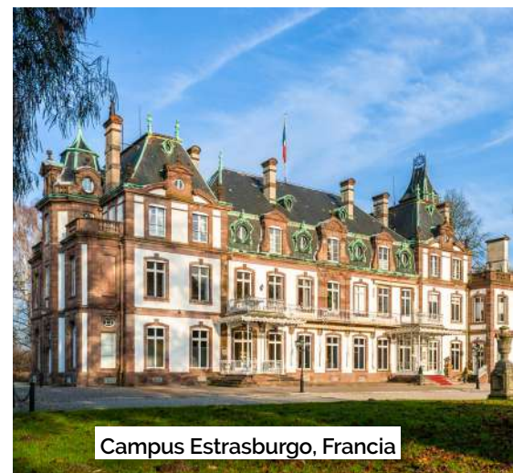
Campus Estrasburgo, Francia