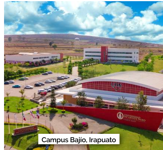
Campus Bajo, Irapuato