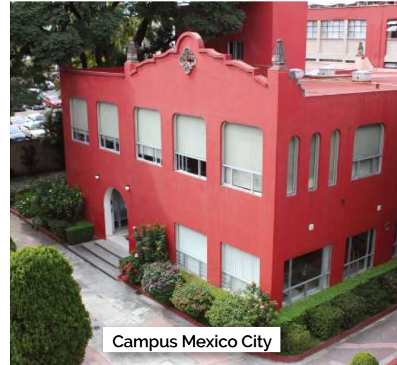
Campus Mexico City